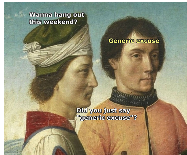
Abb.2: Dialog- Meme