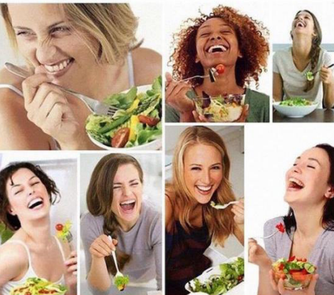
Abb.5: Kommentar- Meme