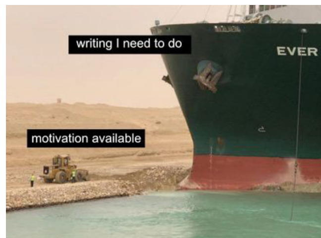
Abb.3: Strukturbild- Meme