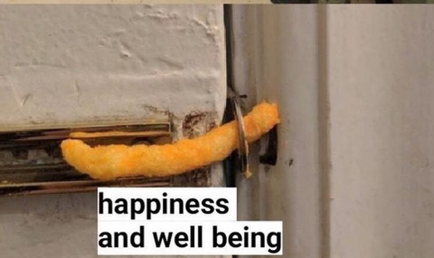
Abb.6 Strukturbild- Meme