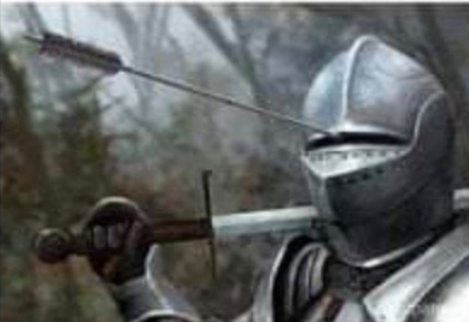
Abb.4: Vorher-Nachherbild- Meme